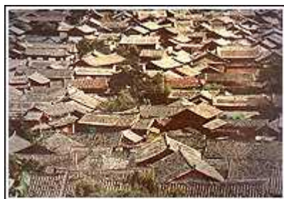
麗江：四方街(世界文化遺産)