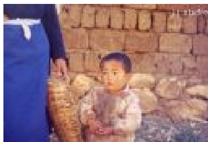
白砂村—納西族の子供