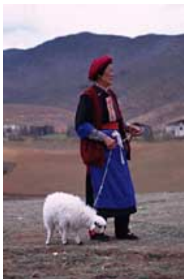
中甸：羊を引く西藏(チベット)族の女性